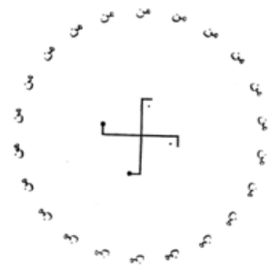
(صفارزاده، ۱۳۶۸: ۶۱)